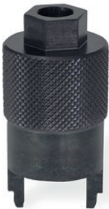
Esempio di applicazione

CARATTERISTICHE E APPLICAZIONI Gli attrezzi di montaggio GN 355.1 vengono utilizzati per la regolazione degli elementi di livellamento GN 355 (vedi pag. 880), solitamente in abbinamento ad una chiave a tubo per il serraggio della vite a testa cilindrica con cava esagonale dell'elemento. Per facilitare la regolazione, l'estremità superiore dell'attrezzo ha una testa esagonale esterna che viene utilizzata per il serraggio. Utilizzare lo strumento di montaggio per la regolazione del posizionamento del corpo dell'elemento di livellamento e avvitare la vite fino ad ottenere la posizione desiderata, quindi serrare per il fissaggio dell'elemento di livellamento.